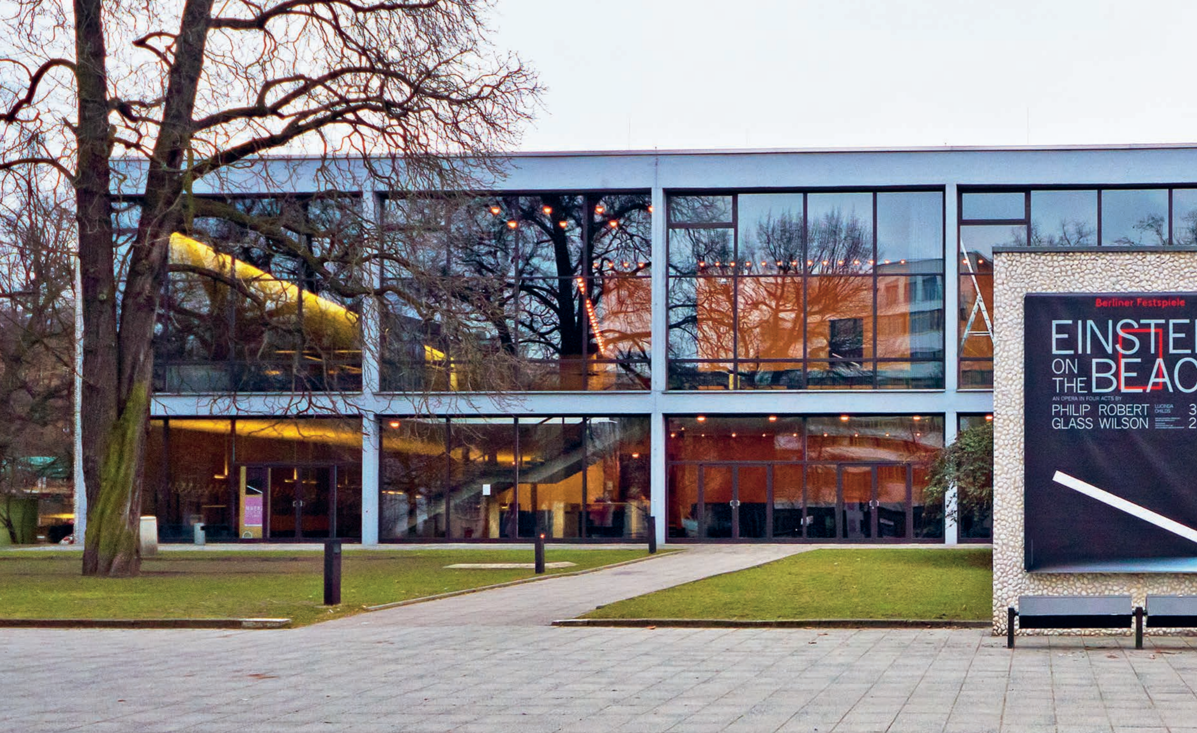
Haus der Berliner Festspiele, Berlin