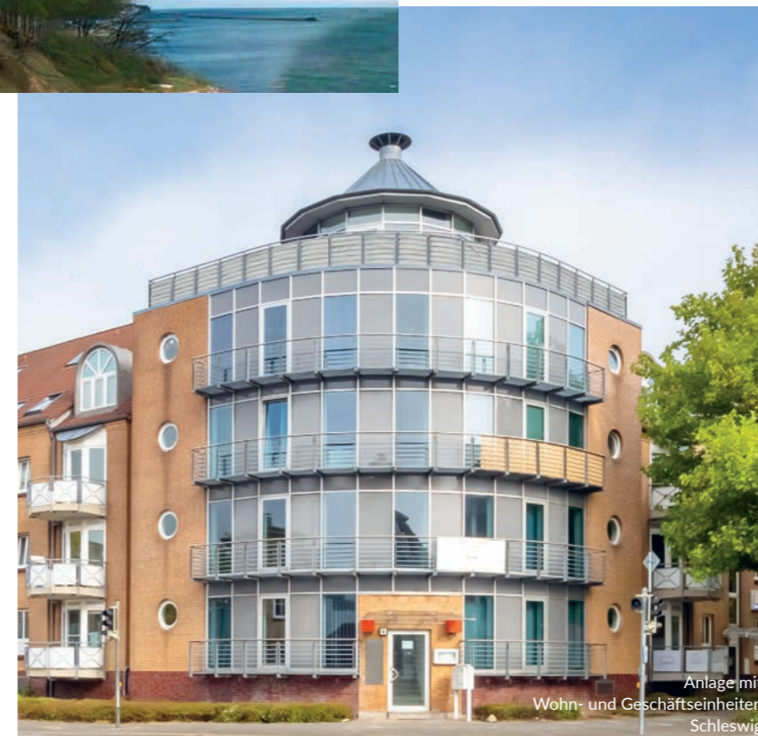
Anlage mit Wohn- und Geschäftseinheiten Schleswig

Ob Finanzierung eines Neukaufs oder Umfinanzierung einer Bestandsimmobilie – wir unterstützen Sie bei der Wahl des richtigen Darlehens und stehen Ihnen während des gesamten Prozesses kompetent zur Seite.