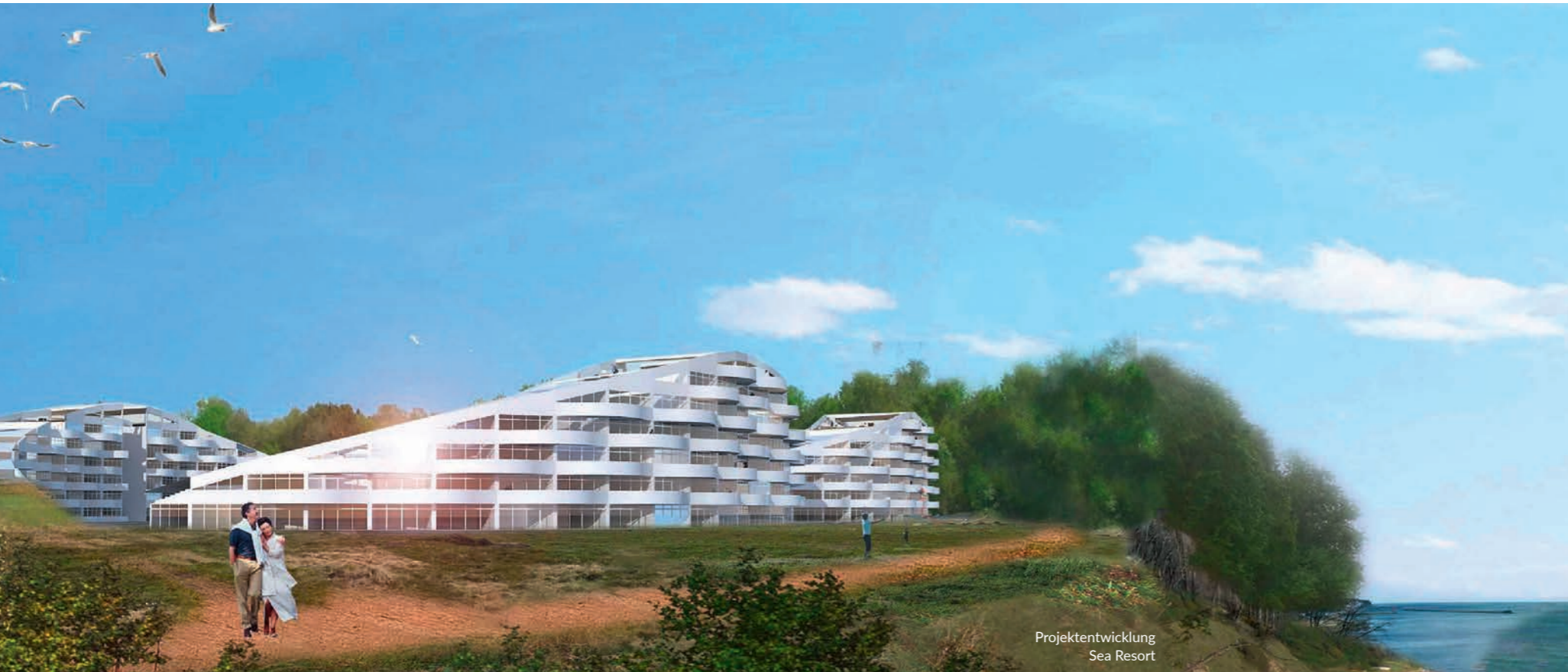
Projektentwicklung Sea Resort